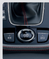
BOTÓN ENCENDIDÓ / AUTOHOLD / PARKING