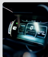
PANEL DIGITAL DE INSTRUMENTOS 12.3"