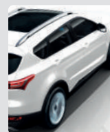
ASISTENTE EN PENDIENTE (HAC)