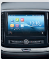
PANTALLA MULTIMEDIA 10"