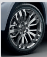
NEUMÁTICOS RIN 20